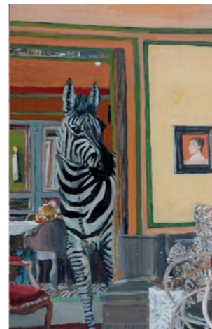
Jürgen Wolf, ohne Titel 2008

Auf der Vorderseite und im Innenteil Robert Weissenbacher „Lichtblicke“ 2017 Beide Bilder © VG Bild-Kunst, Bonn 2017