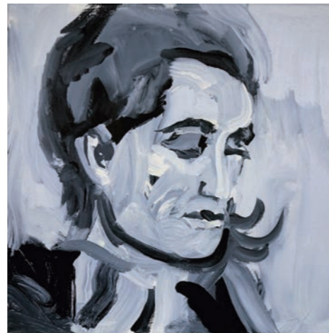
Robert Weissenbacher, ohne Titel 2017

Die Präsentation wird ergänzt durch ausgewählte Bilder der beiden Künstler.