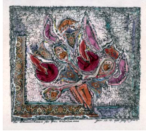
Heinz Hirscher (*1927) Ein Blumentraum (1980) Assemblage und Tusche 19,0 × 20,0 cm