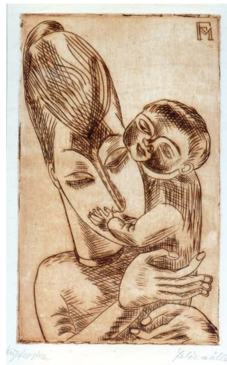
Conrad Felixmüller (1897-1977) Der Sohn (Meine Frau und mein Sohn) (1919) Kupferstich über rotbraunem Plattenton 43,5 × 31,7 cm