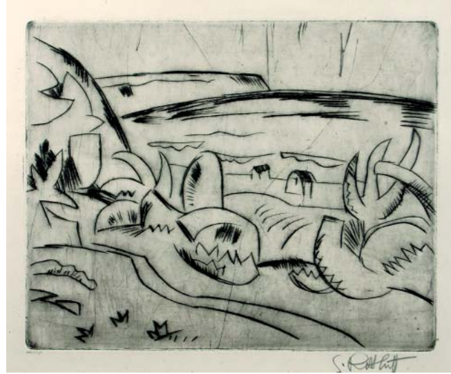
Karl Schmidt-Rottluff (1883-1976) Ostseeküste (1920) Kaltnadelradierung 24,0 × 29,5 cm