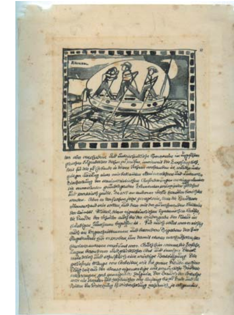
Adolf Hölzel (1853-1934) Drei Ruderer (1918) Tuschezeichnung mit Textblatt 11,0 × 17,5 cm