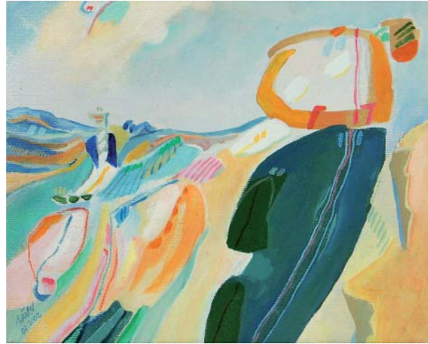
Franz Wörler (*1947) Sommer (2002) Acryl auf Leinwand 24,0 × 30,0 cm